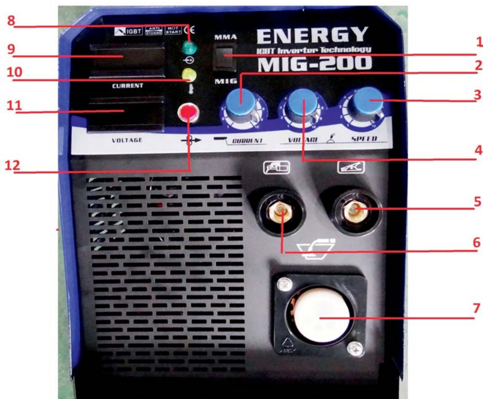
Рис 3.2. Общий вид передней панели ENERGY MIG200